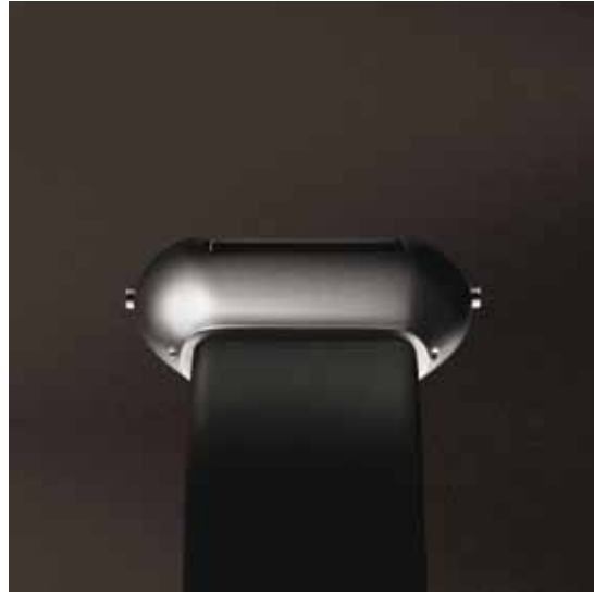
NEOLOG A-24 II bildet die Zeit als Menge ab